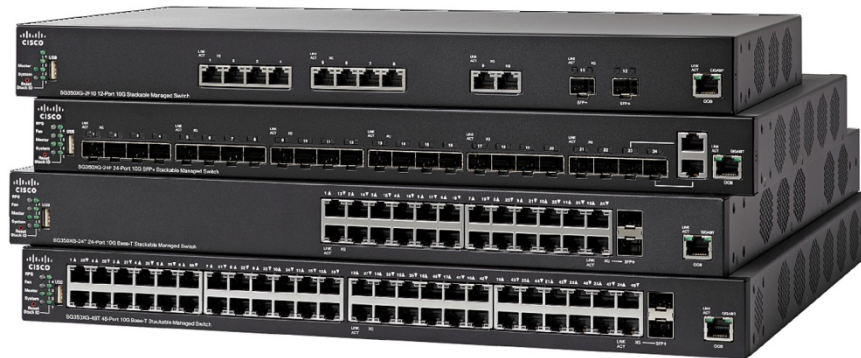
图 1. 思科 350X 系列可堆叠管理型交换机

思科 350X 系列交换机旨在在企业的发展过程中保护您的技术投资。某些交换机虽然声称可以堆叠，但却需要对其中的某些组成部分进行单独管理和故障排除，与之不同的是，思科 350X 系列交换机可以提供真正的堆叠功能，您可以将多台物理交换机作为单个设备来进行配置、管理和故障排除，并且可以更轻松地扩展您的网络。